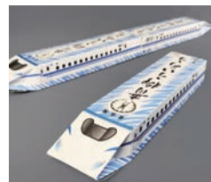
銅賞 MQURE for U / 合同会社ナカナカ