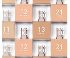
銀賞 IROIKU / 株式会社カナリア