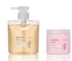
銅賞 MQURE for U / 合同会社ナカナカ