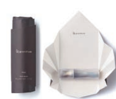
銅賞 MQURE for U / 合同会社ナカナカ