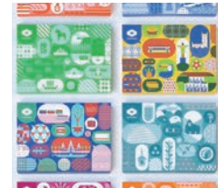
銅賞 うなぎの中庄 うなぎ弁当 / 株式会社サン・アド