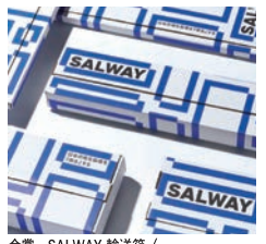
金賞 SALWAY 輸送箱 / 株式会社エイブランドデザイン