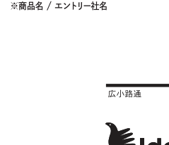
特別審査員賞 能登復興応援酒「つなぐ石川の酒」 / 石浦弘幸