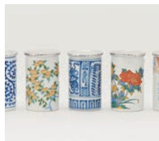
銅賞 NOMANNE / 株式会社アグリエール