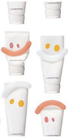
大賞 ホー コスモロジー / 株式会社ホー