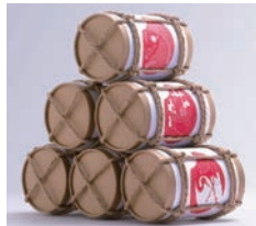
銅賞 新幹線のぞみ30周年記念いろいろ / Peace Graphics