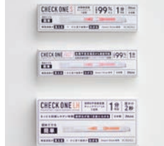
特別審査員賞 CHECK ONE SERIES / RENA