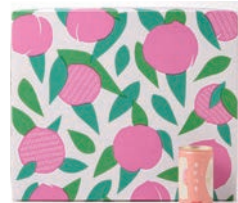
銀賞 CLUB HARIE ハームカーテン羽田空港線パッケージ / 株式会社小野デザイン事務所