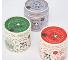
銀賞 madoca / 三原美奈子デザイン