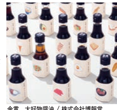
金賞 大好物醤油 / 株式会社博報堂