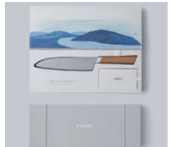
銅賞 KISEKI / 株式会社デザインパーソン