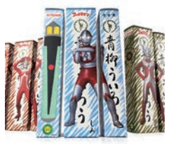
特別審査員賞 ウルトラマンいろいろ / Peace Graphics