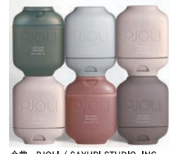
金賞 PJOLI / SAYURI STUDIO, INC.