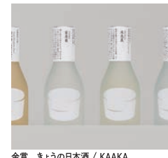
金賞 きょうの日本酒 / KAAKA