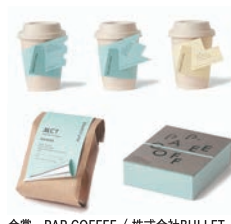
金賞 PAP.COFFEE / 株式会社BULLET