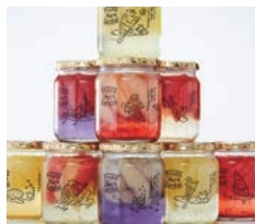
銅賞 農園応援ふくしまあかつき桃ジュース / カゴメ株式会社