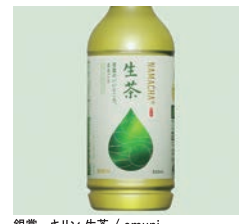
銀賞 キリン 生茶 / emuni