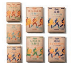
銅賞 業務用米粉シリーズ / アイラスデザイン株式会社