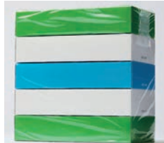
銀賞 (ふつ)のマヨネーズと(ふつ)のケチャップ / 銀賞 haccoba 田んぼシリーズ / summit KAAKA