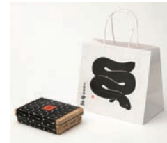
銅賞 うなぎの中庄 うなぎ弁当 / 株式会社サン・アド