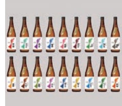
特別審査員賞 能登復興応援酒「つなぐ石川の酒」 / 石浦弘幸