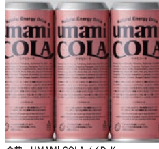
金賞 UMAMI COLA / 6D-K

日本パッケージデザイン大賞は公募により広く作品を募集し作品のデザイン性や創造性を競うコンペティションです。1,000点の作品から会員審査員と外部特別審査員による厳正な審査を経て、大賞・金賞・銀賞・銅賞・特別審査員賞などが選出。日本パッケージデザイン大賞2025巡回展は受賞作品に加え中部地域のデザイナー・企業の入選作品も展示します。