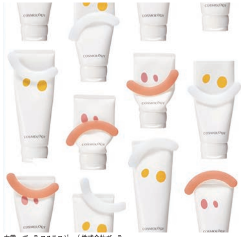
大賞 ホー コスモロジー / 株式会社ホー