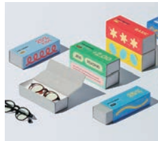
銅賞 JINS SCREEN/READING/PROTECT / ONE inc.