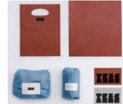
銀賞 CLUB HARIE ハームカーテン羽田空港線パッケージ / 株式会社小野デザイン事務所