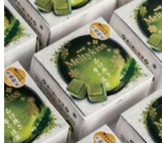
特別審査員賞 能登復興応援酒「つなぐ石川の酒」 / 石浦弘幸