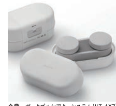
金賞 きょうの日本酒 / KAAKA