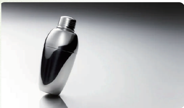
2024年度グッドデザイン賞/カクテルシェーカー『バーディ』

参加者同士の交流や情報交換の場としてもご活用いただけます。2025年度の応募受付は4月1日～5月22日。応募を検討の方、Gマークに興味のある方はぜひお気軽にご参加ください。