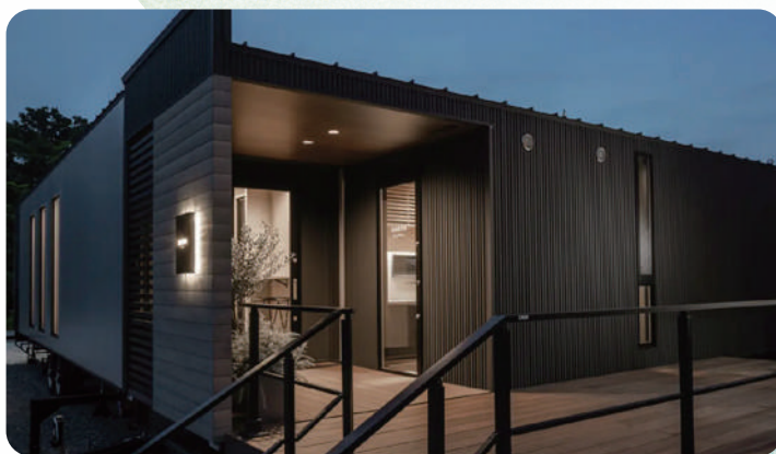
2024年度グッドデザイン賞/トレーラーハウス『アワーズ』